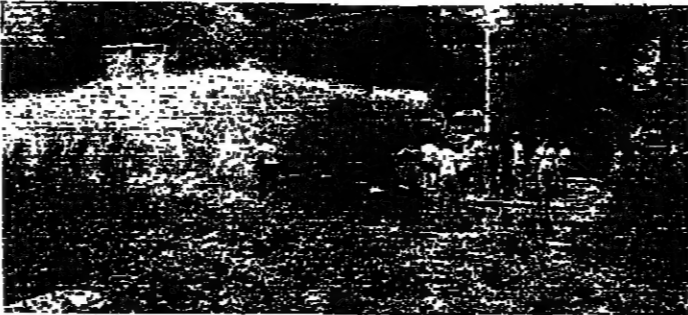
خرابيم المياه تواجه «الفهود السود» الاسراييليين بطنين

اليهودية الى اسراييل تحوي على اميرين رئيسيين بالنسبة لانه الطوائف الشرقية الأول: توجه قسم كبير من اموال الدولة لشؤون استيعاب المهاجرين الجدد على حساب مجموعة الاوضاع القاسية للطوائف الشرقية، والتي زيادتاً عند ابناء الطائفة الاشكنازية نتيجة هذه الهجرات، خاصة وان الاكثية الساحقة من اليهود في العالم هم من ابناء الطوائف الغربية (الاشكناز) الابر الذي يؤدي بالتالي الى تحويل الاشكناز من اقلية الى اقلية في اسراييل.